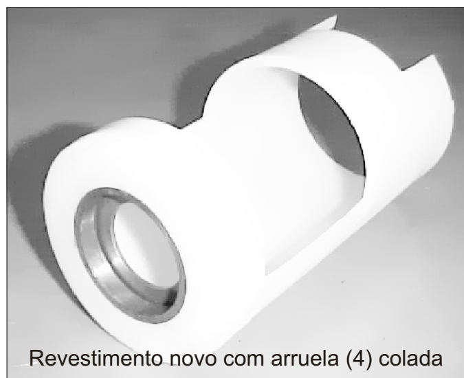
Revestimento novo com arruela (4) colada